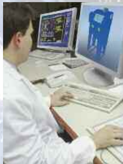
DEPARTAMENTO DE INGENIERÍA I+D