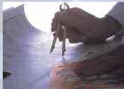
PLANIFICACIÓN Y DESARROLLO

Disponemos de servicio técnico post-venta con stock permanente de recambios y abrasivos