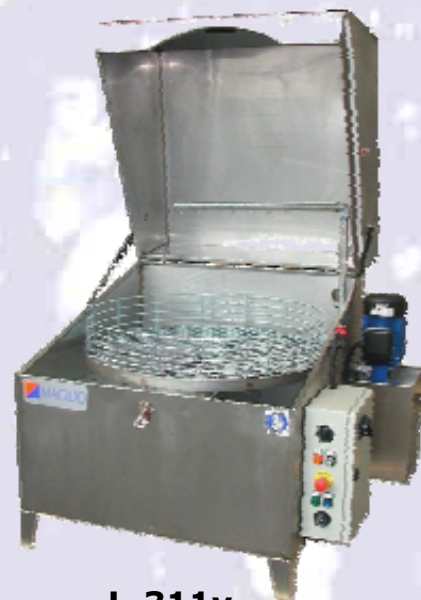
L-311v L-321v L-331v