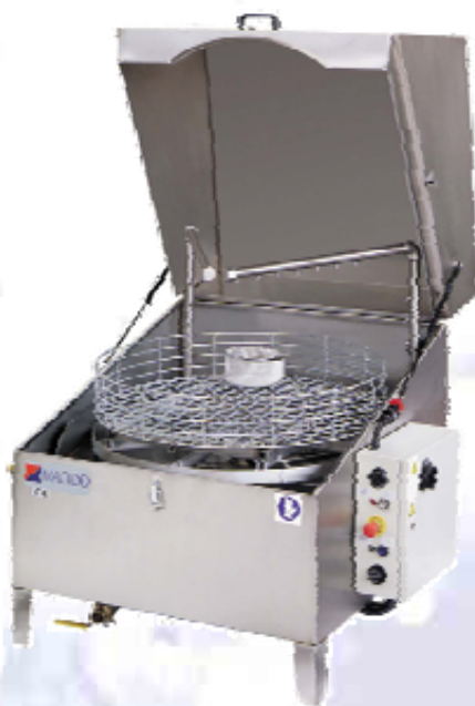
L-101 L102 L-122