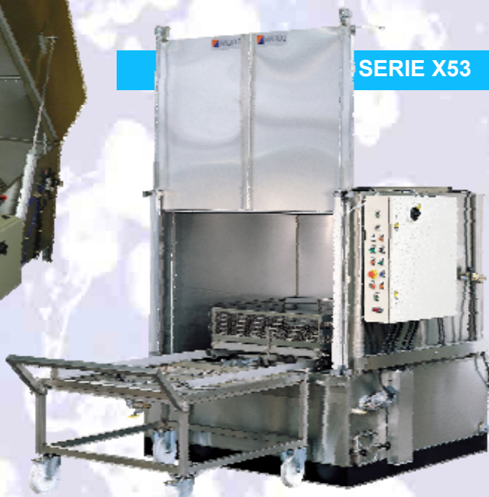
L-160 L-190 L-210